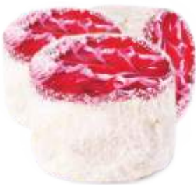
Фламинго Нежный бисквит со сливками в кокосовой стружке, декорированный клубничным и ванильным гелем