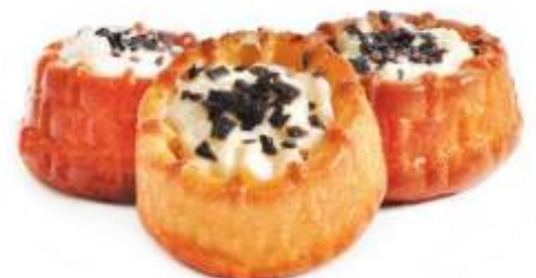
Шарлотка молочная Бисквитная корзиночка наполненная молочно-яблочной начинкой