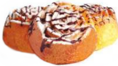
Флорентино Творожный кекс декорированный глазурью