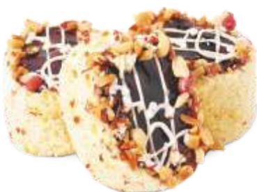
До-ре-ми Бисквит со сливками, изюмом и яблоками, декорированный шоколадным гелем и арахисом