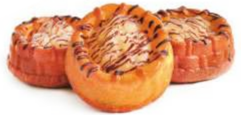
Шарлотка Бисквитная корзиночка наполненная яблочным наполнителем