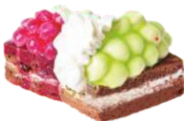
Виноград Бисквитно-шоколадное пирожное со сливками, изюмом и фруктовым гелем