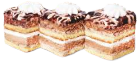
Натали Бисквитно-кремовое пирожное с масляным кремом с шоколадной прослойкой, декорированное шоколадным гелем