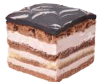
Доминик Шоколадное пирожное с масляным кремом, глазированное