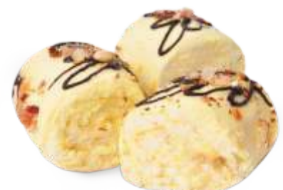
Африка Нежный бисквит с банановым кремом