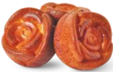
Творожный цветок Кекс с творогом