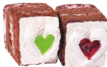
Валентинка Шоколадное пирожное с вишней и сливками