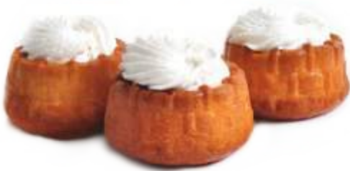
Французская ватрушка Бисквитная корзиночка наполненная творожным кремом