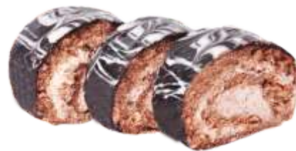
Цыганочка Бисквитно-шоколадное пирожное с масляным кремом укрытое глазурью