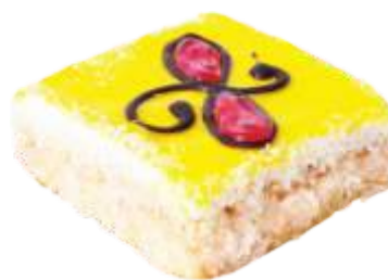
Шахирезада Бисквитно-кокосовое пирожное с персиковой начинкой, сливками и лимоном