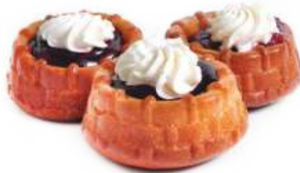
Жозефина Бисквитная корзиночка с киви, вишней и творожным кремом