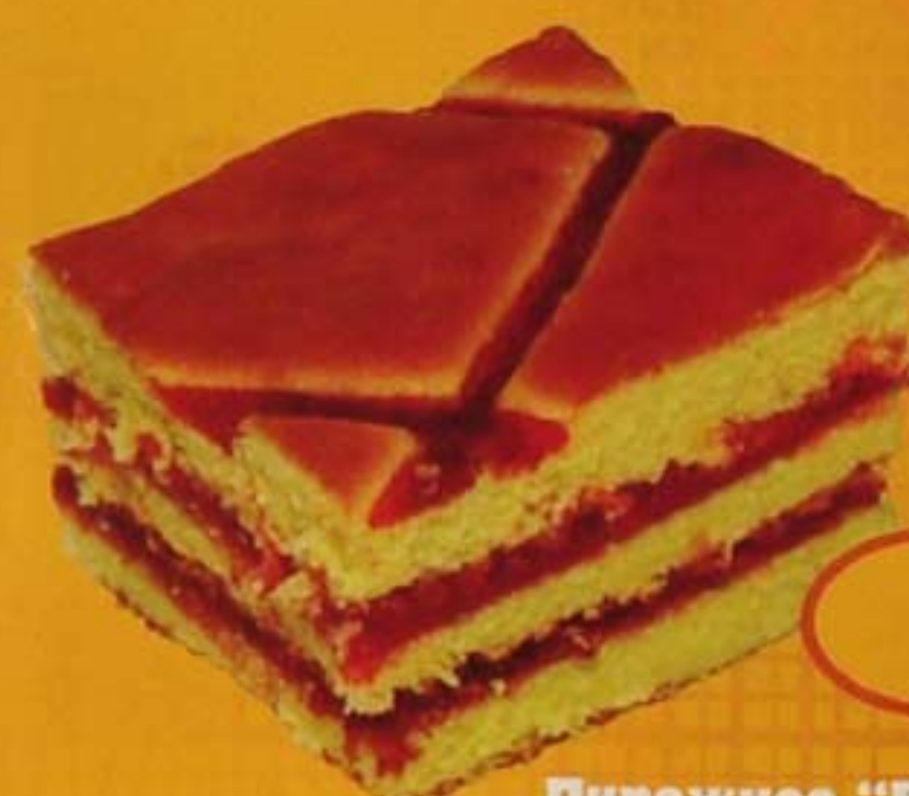
Пирожное "Вишенка" бисквитное с джемом (сгущ.)