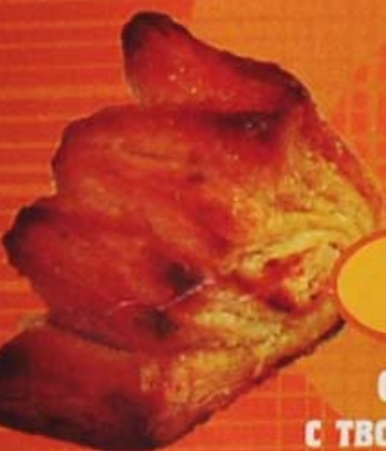
Слойка с творогом