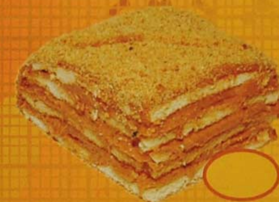
Медовик с уваренным сгущ. молоком (сметана)