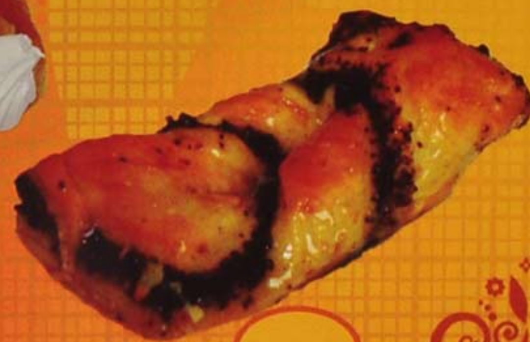
Слойка с маком "Хрустик"