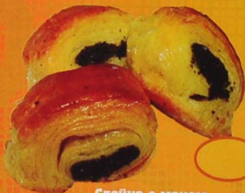
Слойка с маком