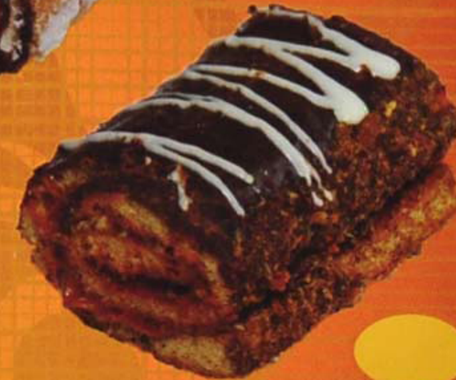
Рулет "Пчелка" медовый