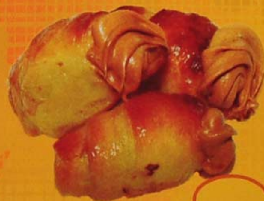
Трубочка слоеная с уваренным сгущенным молоком