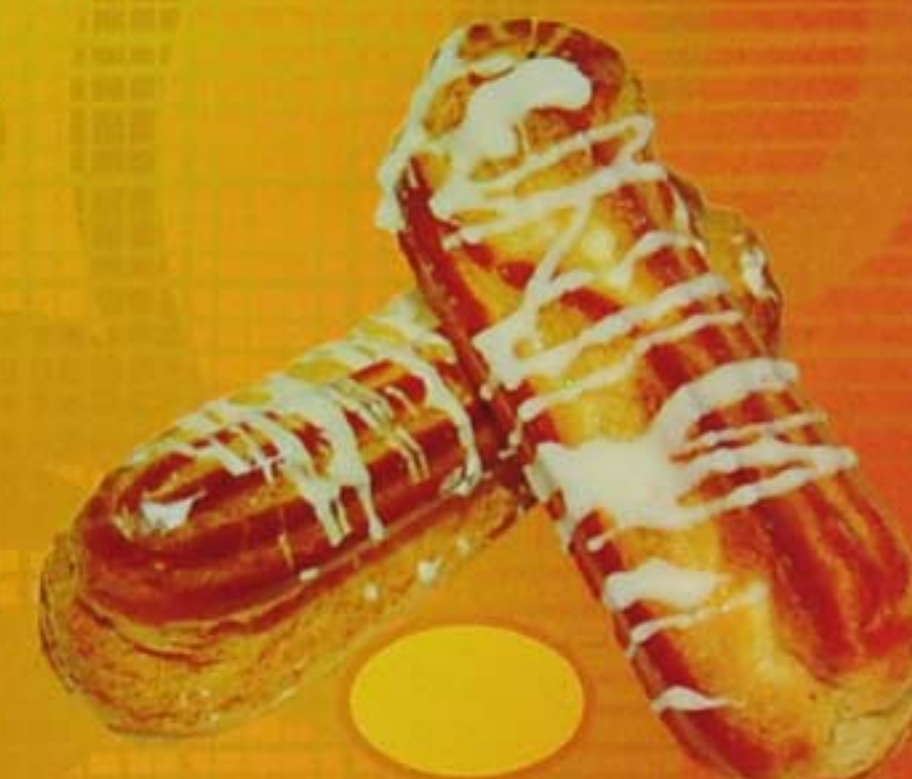
Пирожное "Заварное" со сливочным кремом (сгущ.)