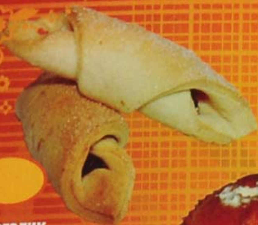
Рогалик с джемом (творог)