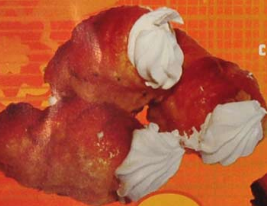
Трубочка слоеная со сливочным кремом